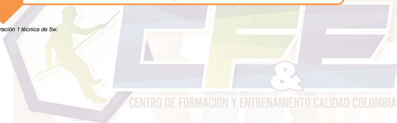
Ilustración 1 técnica de 5w.

CENTRO DE FORMACIÓN Y ENTRENAMIENTO CALIDAD COLOMBIA